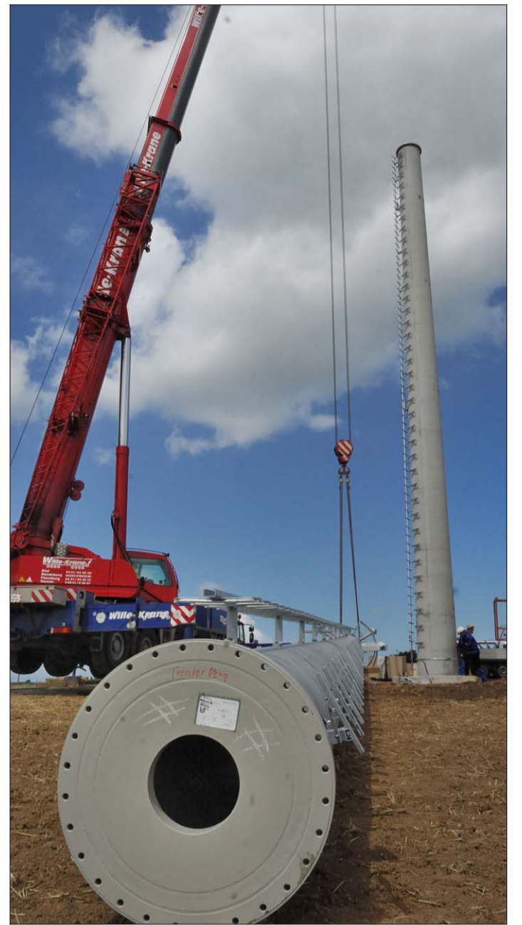
Der obere Teil des Funkmastes liegt bereit und wird für die Montage auf der gleichlangen 20 Meter hohen Basis vorbereitet.