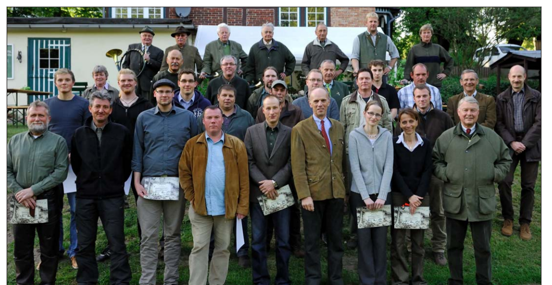
17 Jungjäger sowie neun Ausbilder und die Prüfungskommission posierten nach der Übergabe der Jägerbriefe für das Abschlussfoto des Lehrgangs vor dem Schwentine-Infozentrum.