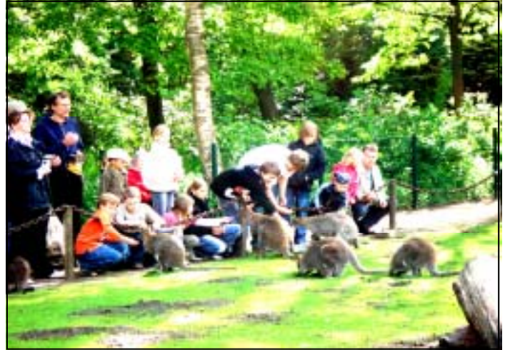
Man sieht wie zutraulich die Kängeruhs waren und den Kindern Zwieback und Krafftutter aus der Hand fraßen. Schalen mit Gemüse wurden extra hingestellt und die JRKler stellten begeistert fest: "Die haben ja ganz weiche Schnauzen!"

Im heutigen Naturpark Westensee liegt das Gut Emkendorf. Emkendorf ist eines der ältesten Güter des Landes und zeitweise war es mit 1 Quadratkilometer auch das größte in den Herzogtümern Schleswig und Holstein.