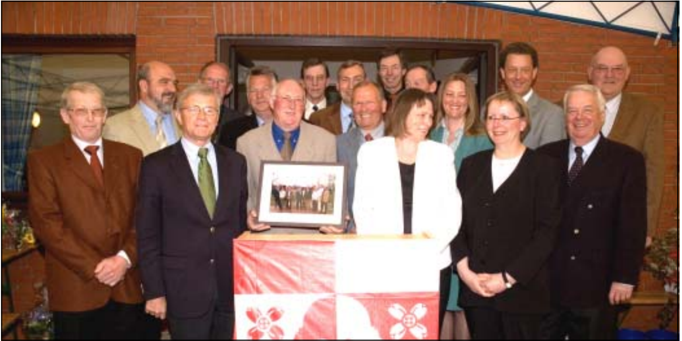
Gruppenbild: Der Jubilar mit seinen Kolleginnen Bürgermeisterinnen und Bürgermeistern sowie dem Landrat des Kreises Plön