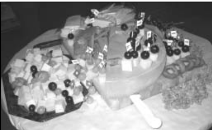
Das Büfett mit Käsespezialitäten - nicht nur aus der Schweiz.

Im Herbst wurde eine Verschönerungsaktion in der Gemeinde durchgeführt. Nach einem Aufruf kamen viele Einwohner zusammen, um eine große Anzahl von Blumenzwiebeln zu pflanzen. Eine weitere Aktion ist in diesem Jahr geplant.