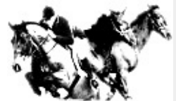
gez. Christa Dibbern

Jeder Teilnehmer erhält eine Erinnerungsschleife, Sieger und Platzierte erhalten einen Ehrenpreis.