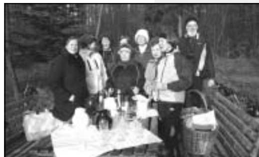
Foto: Silvesterwalking an Försters Diek beim Klönschnack

gend auf dem Stuhl geübt. Es gehören aber auch Übungen im Stand und auf dem Boden dazu. Die Übungen werden insgesamt langsamer und sanfter durchgeführt und sind deshalb auch für Menschen mit leichten Bewegungseinschränkungen möglich.