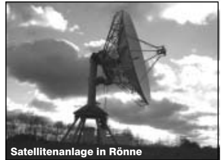
Satellitenanlage in Rönne