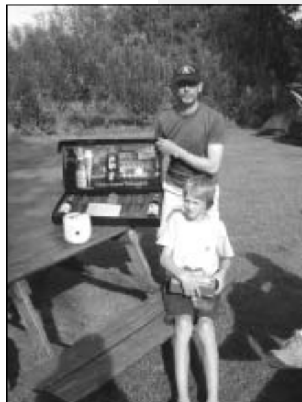
Die Sieger bei Kindern und Erwachsenen