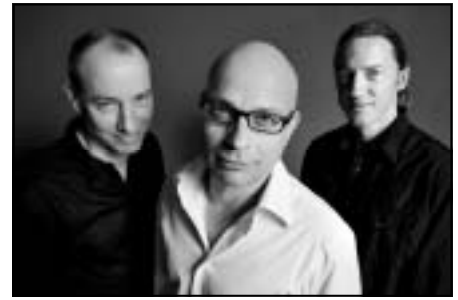
The Crazy Hambones.