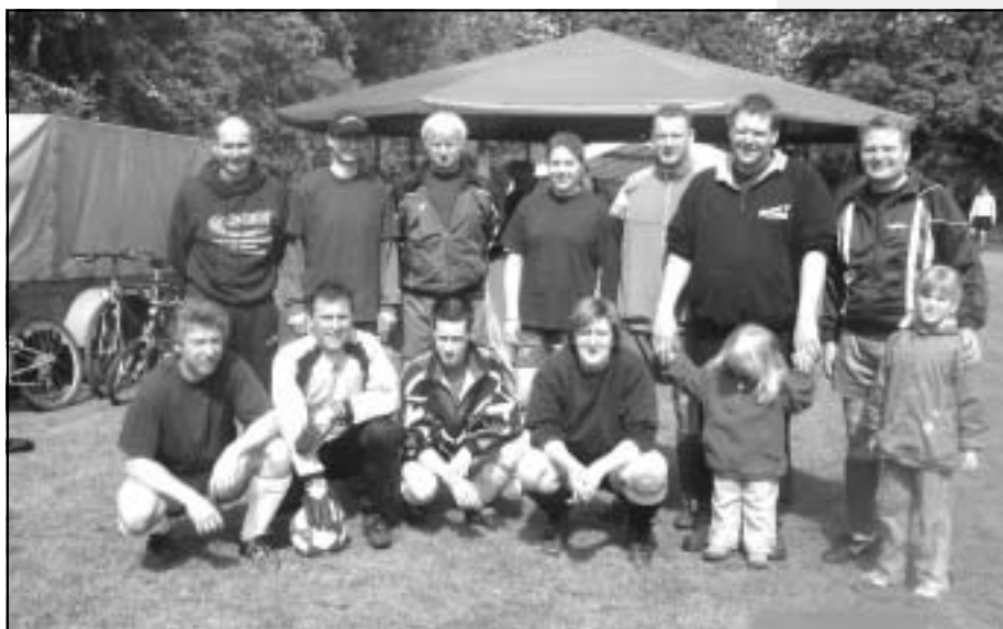
Das Urgestein beim Himmelfahrtsturnier: Die Mannschaft der FF Kirchbarkau.

In der dunklen Jahreszeit haben wir außer unseren Hallentrainingszeiten auch einige Hallenturniere zu bestreiten.